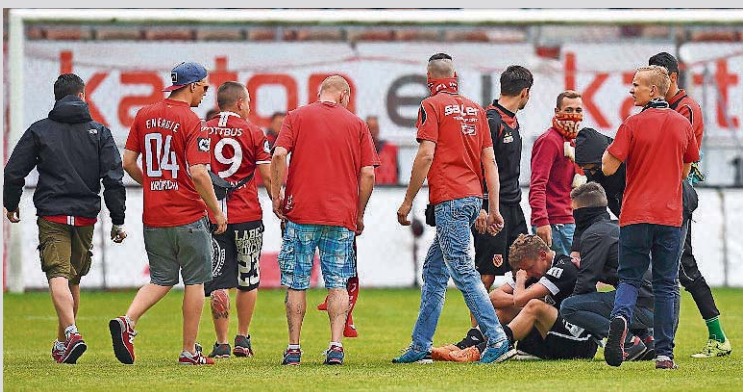
Der Platzsturm nach dem Schlusspfiff blieb größtenteils friedlich. Dennoch: Der Sicherheitsdienst hat dort versagt.