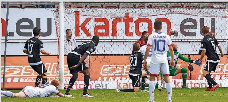
Das Tor aus dem Hinterhalt: Der Mainzer Kalig (l.) trifft artistisch zum 2:2 und erlegt damit die Fußball-Lausitz.