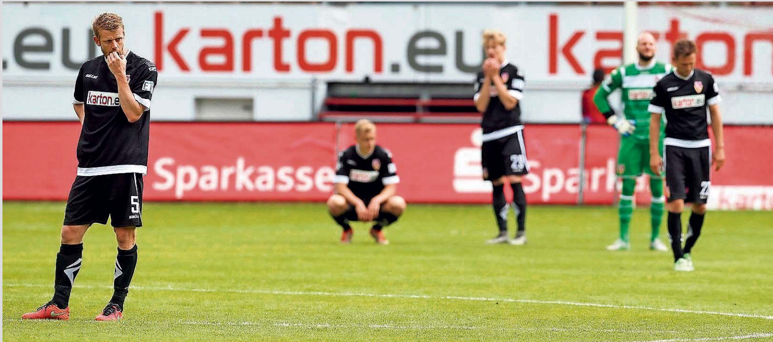
Fassungslosigkeit: Nach 19 Jahren Profi-Fußball ist alles vorbei. Der FC Energie Cottbus ist nun viertklassig.