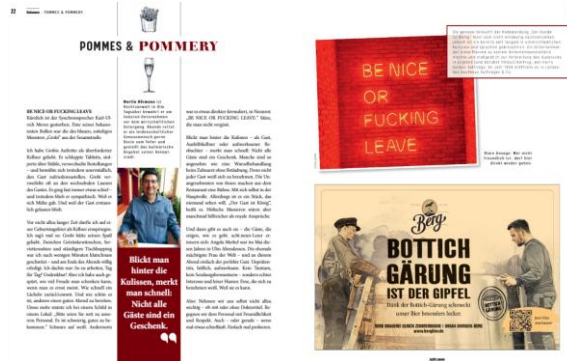
Kolumnen von Ulmer Persönlichkeiten