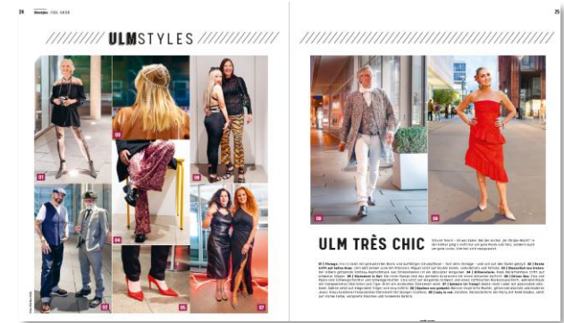
Modische Trends: „Ulm Styles“