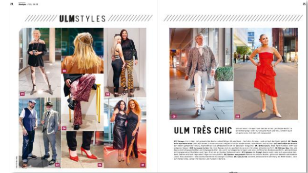
Modische Trends: „Ulm Styles“