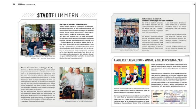
News und Tipps bietet „Stadtflimmern“