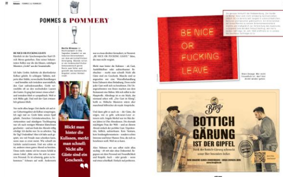
Kolumnen von Ulmer Persönlichkeiten