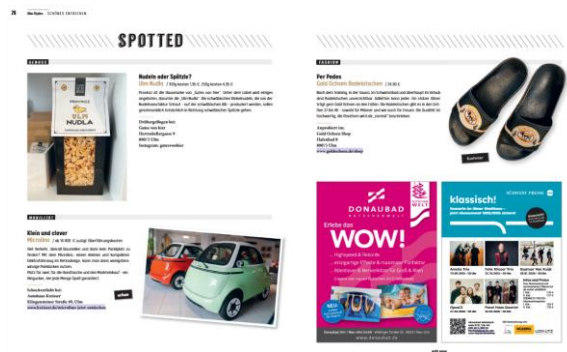
Originelle Produkte mit Ulmer Bezugsquellen